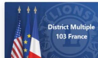
DM 103 France