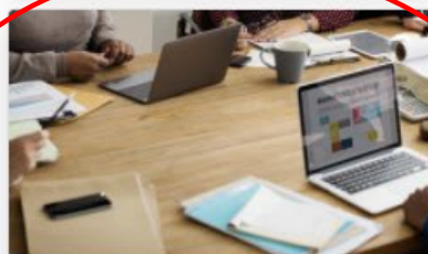
Gestion du Club