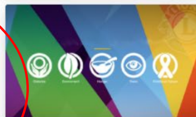
Le Service Lions