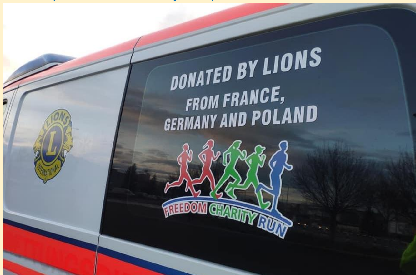
Les pasteurs gouverneurs en soutien de l'action internationale de district Dernier achat : une ambulance par les districts jumelés ; la France est représentée par 103CS

Les représentants des districts jumelés, soutenant l'action à ARSAL AU LIBAN