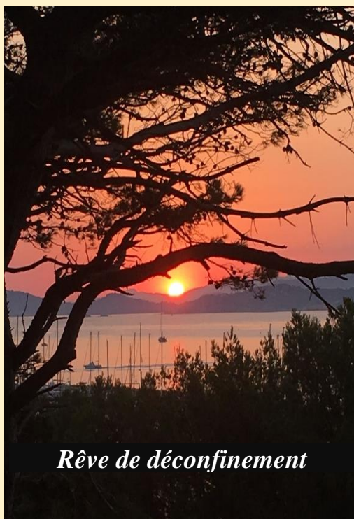
Rêve de déconfinement

Anciens gouverneurs du Lions club de France Association loi 1901 – Siège Social 295, rue Saint-Jacques – 75005 – PARIS