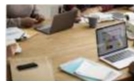
Gestion du Club