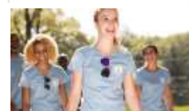
Rapport d'Activité de Club